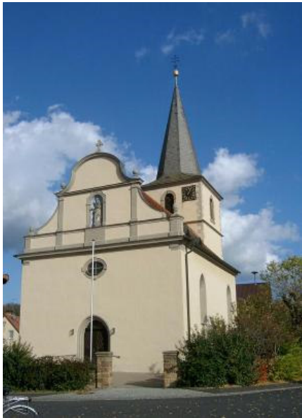
Foto: Kirche Mariä Himmelfahrt, Mönchstockheim (Pfarreiengemeinschaft Marienhain)

Herzliche Einladung an alle Ehepaare, die im Jahr 2025 seit 20, 30 oder 40 Jahren verheiratet sind